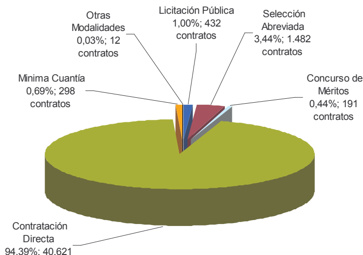
Gráfico No. 3 Porcentaje de número de contratos por modalidad