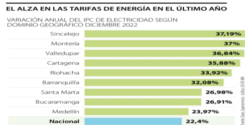
Figura 1. Alza de las tarifas de energía en 2022.

En 2022, la tarifa de energía cerró con un alza del 22,4% en promedio a nivel nacional y en la región caribe entre 26,28% y 37,19%, en contraste con el 13,12% del Índice de precios al Consumidor (IPC). A continuación, se relacionan otras ciudades con significativas alzas de tarifas de energía eléctrica.