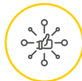
Entérese del Cambio