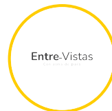
Entre-Vistas con alma de país