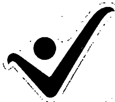
FIGURA 7. Forma del sello positivo

Parágrafo. No se puede utilizar otro tipo de forma de sello positivo, ni cambiar el color, añadir letras o frases, ni tamaños, ni ubicación.