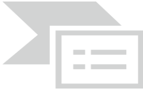
Vo.Bo. Jefe Oficina Asesora Juridica