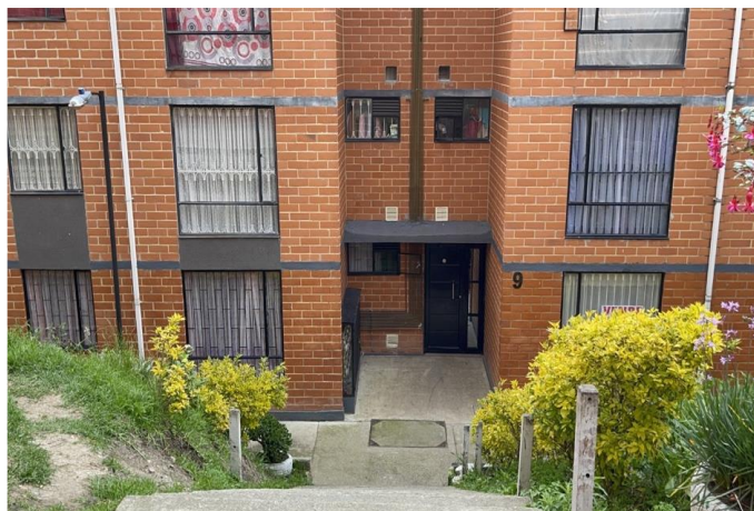
Imagen tomada desde la parte superior