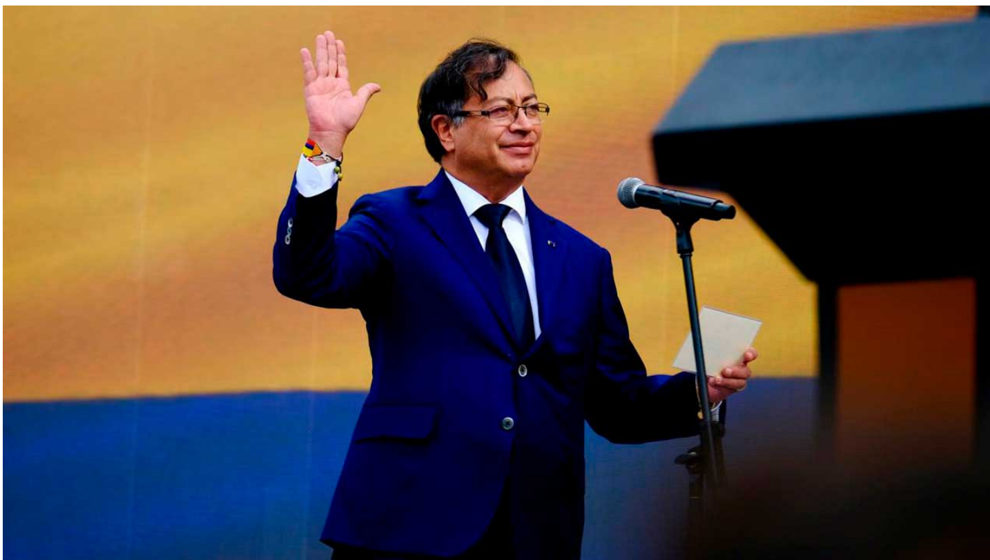
Bogotá, 7 de agosto de 2022.