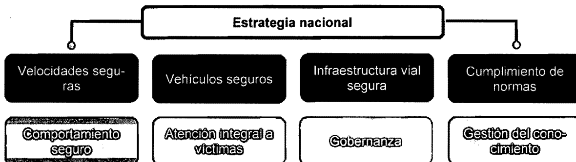
Ilustración 1. Áreas de acción de la estrategia nacional del PNSV 2022 - 2031

La estrategia nacional define el trabajo del Gobierno nacional sobre 8 áreas de acción a partir del análisis y gestión de los factores que contribuyen a la conformación de escenarios de riesgo para los actores viales, así como de las necesidades que en materia de gobernanza y gestión de conocimiento requiere el país para avanzar en la adopción del enfoque Sistema Seguro.