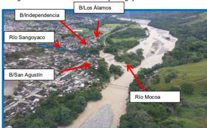
Fotografía 1: inundación río Mocoa y Sangoyaco

⊕ Amenaza por Deslizamientos o Remoción en Masa Los deslizamientos de tierra, es un término general que cubre una amplia variedad de formas y procesos relacionados al movimiento de descenso del suelo y roca por la influencia de la gravedad, La amenaza por deslizamiento se presenta como caídas, reptación, desprendimientos, y flujos de lodos en su mayoría asociada a eventos relacionados a la impermeabilidad